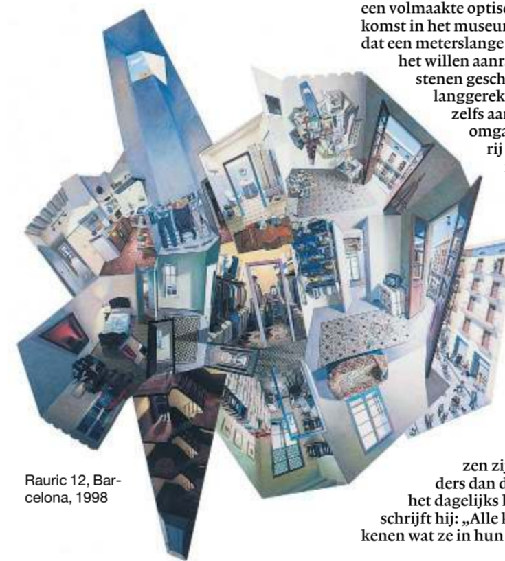
Rauric 12, Barcelona, 1998

stenen geschilderd. Als je langs de langgerekte muur loopt, kun je zelfs aan het einde ervan de hoek omgaan. Op een ander schilderij zweven twee stoelen in de ruimte. Een ouderwetse telefoon staat op de ene stoel, de hoorn ligt op de andere. Door de geraffineerde manier waarop de stoelen zijn geschilderd, lijken ze driedimensionaal. De ondertitel getuigt van een subtiel gevoel voor humor: „Je kunt beter even gaan zitten, ik heb je iets belangrijks te vertellen.“ Volgens Critchley behelzen zijn tekeningen niets anders dan dat weer te geven wat hij in het dagelijks leven ziet. In de catalogus schrijft hij: „Alle kinderen tekenen en ze tekenen wat ze in hun dagelijkse leven tegenko-